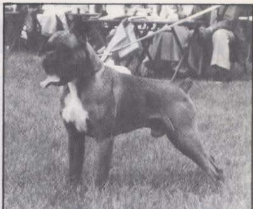
Quanto v. Hessen Nassan.