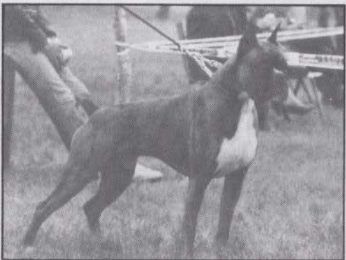
Fork del Retiro.