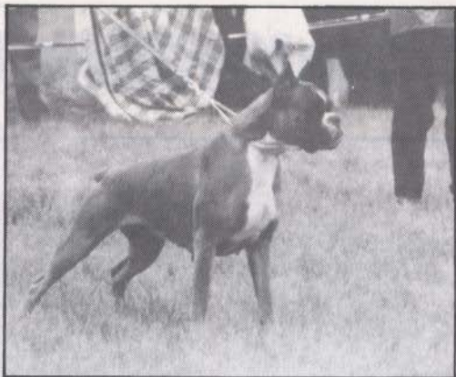
Tara de Gengis khan.

En fin, una buena exposición, entretenida, con bastantes ejemplares excelentes, algo deslucida por la lluvia en su comienzo pero muy agradable e interesante en líneas generales.